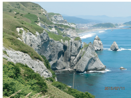
室蘭 地球岬の絶景