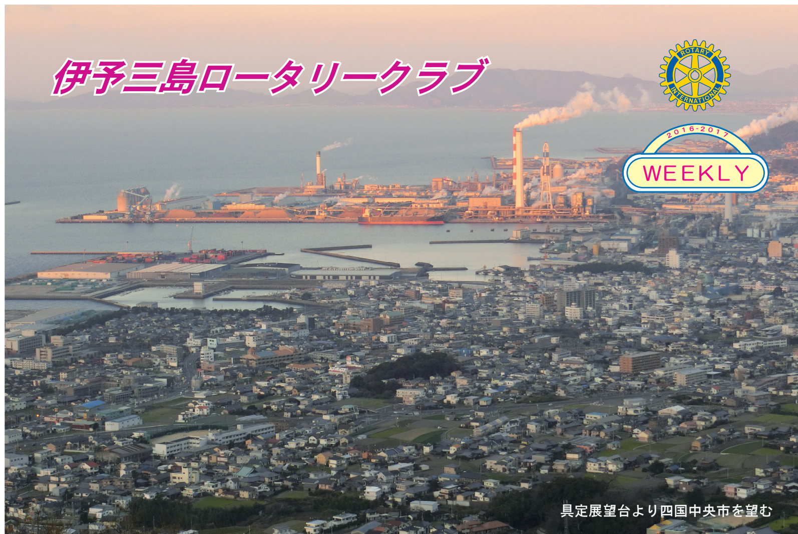
具定展望台より四国中央市を望む