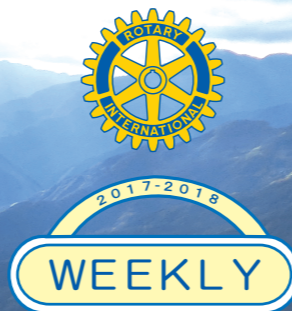
初冬の金砂湖・嶺南地方