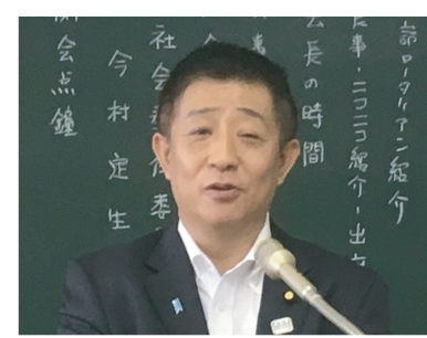
参議院議員 井原 巧

社会に奉仕し地域に住む人々の生活の質を高めていくなかで、やはり政治の役割は必須でありますので、本日は井原巧参議院議員様に社会奉仕の話はもとより、平成の先の時代に向かってこれからの日本についてお話しいただきたいと思っておりますので、どうぞ宜しくお願い致します。